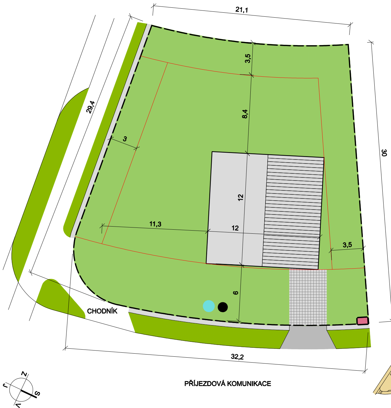
SITUACE ETAPY 1.C